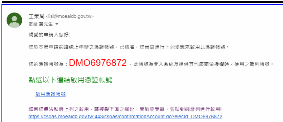
【圖表 2】帳號啟動電子郵件